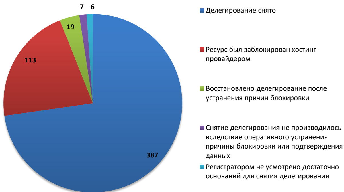
Рис.3 Итоги обработки обращений о снятии делегирования (октябрь 2019)

В настоящее время остаются заблокированными 387 доменных имен (в 19 случаях делегирование было восстановлено по ходатайству соответствующей компетентной организации после устранения причины блокировки).