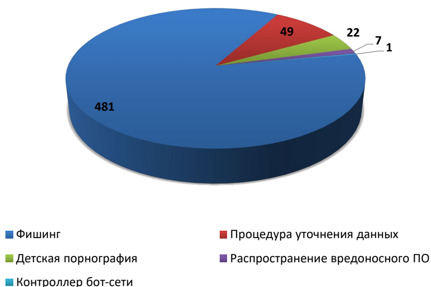
Рис.1 Распределение доменов по видам вредоносной активности (январь 2021)

Анализ доменов-нарушителей по типу выявленной вредоносной активности в отчетном периоде показал, что лидирующее место принадлежит доменным именам, связанным с фишингом (481 обращение). Далее следуют ресурсы с порнографическим материалом с участием несовершеннолетних (22 обращения), ресурсы используемые для распространения вредоносного программного обеспечения (7 обращений) и контроллеры бот-сетей (1 обращение). Также, 49 обращений были направлены компетентными организациями, с просьбой инициировать проверку идентификационных сведений администратора.