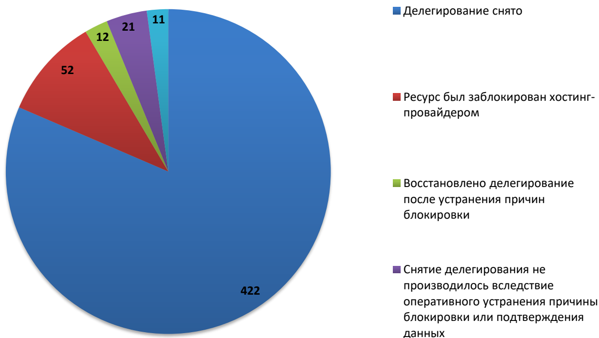
Рис.3 Итоги обработки обращений о снятии делегирования (ноябрь 2019)

За отчетный период по обращениям компетентных организаций были сняты с делегирования 434 доменных имени. Для 21 доменного имени снятие делегирования не потребовалось вследствие оперативного устранения причин блокировки администратором домена или своевременного подтверждения администратором домена идентификационных данных. В 52 случаях, снятия делегирования не потребовалось, так как ресурс был заблокирован хостинг-провайдером. В 11 случаях, регистратором не усмотрено достаточно оснований для снятия делегирования или инициирования проверки администратора. На момент подготовки отчета, 58 обращений находились в статусе обработки.